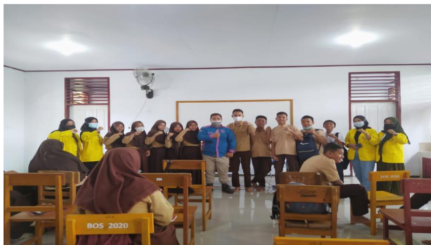
Gambar 4. Penutupan kegiatan pengabdian dengan foto bersama

Pendidikan kesehatan seperti penyuluhan merupakan upaya yang direncanakan untuk mempengaruhi orang lain, baik individu, kelompok maupun masyarakat, sehingga mau melakukan apa yang diharapkan oleh pendidik atau promotor kesehatan. Hasil yang diharapkan berupa perilaku yang baik dalam memelihara dan meningkatkan derajat kesehatan (Notoatmodjo, 2012). Hasil pengabdian ini didukung oleh penelitian Made Rismawan di Denpasar yang menyatakan bahwa sekolah memiliki peran penting sebagai penyebaran informasi ke siswa tentang pelaksanaan PHBS di lingkungan sekolah atau masyarakat (Rismawan dkk, 2018).