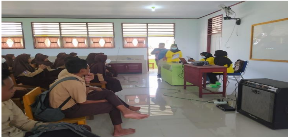
Gambar 1. Pembagian Kuesioner Pretest kepada Peserta