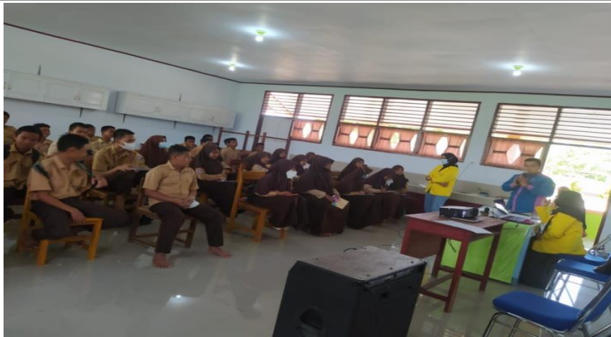
Gambar 3. Pembagian kuesioner posttest kepada peserta

Pendidikan kesehatan seperti penyuluhan merupakan upaya yang direncanakan untuk mempengaruhi orang lain, baik individu, kelompok maupun masyarakat, sehingga mau melakukan apa yang diharapkan oleh pendidik atau promotor kesehatan. Hasil yang diharapkan berupa perilaku yang baik dalam memelihara dan meningkatkan derajat kesehatan (Notoatmodjo, 2012). Hasil pengabdian ini didukung oleh penelitian Made Rismawan di Denpasar yang menyatakan bahwa sekolah memiliki peran penting sebagai penyebaran informasi ke siswa tentang pelaksanaan PHBS di lingkungan sekolah atau masyarakat (Rismawan dkk, 2018).