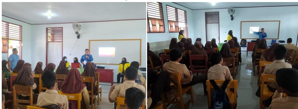
Gambar 2. Pemaparan Materi Penyuluhan

Pada tahapan ini pemateri menjelaskan materi tentang PHBS dan bahaya perilaku merokok. Materi dipaparkan secara panel oleh dua orang pemateri. Saat proses penyuluhan kesehatan berlangsung, para siswa sangat antusias dalam mendengarkan dan menyimak materi yang disampaikan. Bahkan ada beberapa siswa yang tidak sabar untuk mengajukan pertanyaan. Maka setelah materi diberikan waktu untuk diskusi dan menjawab pertanyaan dari beberapa siswa. Sesi diskusi ini juga diharapkan dapat membuat para siswa lebih paham lagi dengan materi yang diberikan. Sehingga dapat mewujudkan tujuan dari kegiatan pengabdian yaitu meningkatkan pengetahuan dan kesadaran siswa tentang hidup bersih dan sehat serta bahaya dalam mengomsumsi rokok. Siswa juga diharapkan mampu menerapkan hasil pengetahuan tersebut dalam kehidupan sehari-hari.