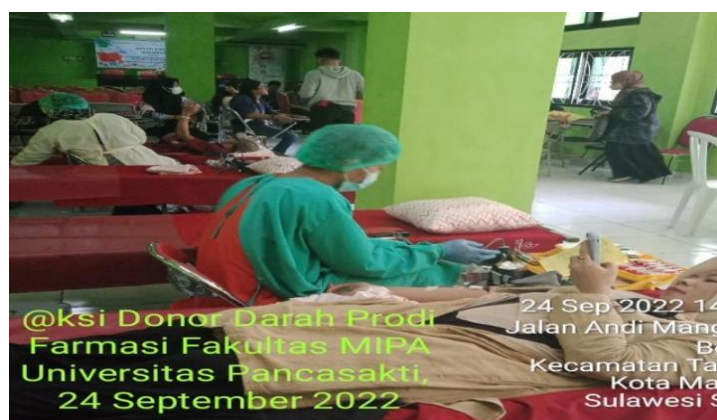
Gambar 1. Proses Pengambilan Darah

Bagi peserta yang telah mendonorkan darahnya mendapatkan bingkisan dari UPT Transfusi Darah Dines Kesehatan Provinsi Sulawesi Selatan sebagai sebagai bentuk penghargaan atas partisipasinya dan juga sebagai motivasi agar terus berkontribusi melakukan donor darah secara rutin.