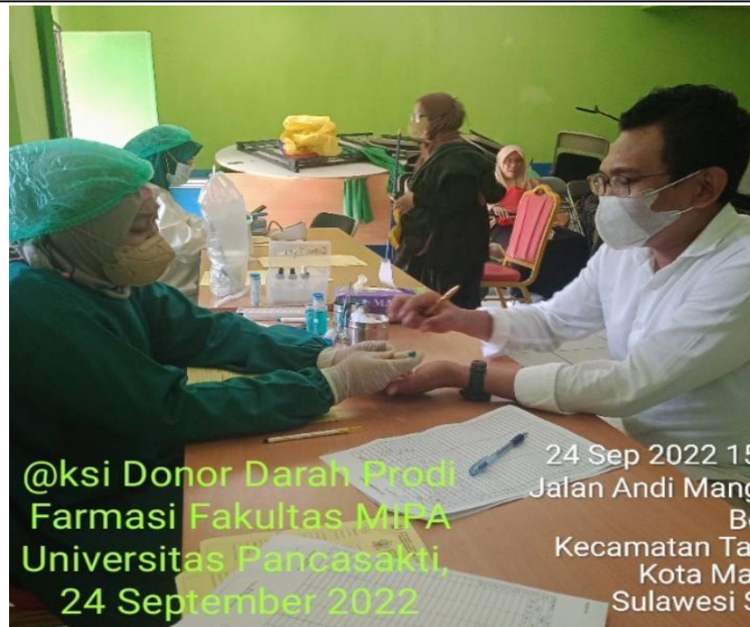
Gambar 2. Proses Pemeriksaan Kesehatan