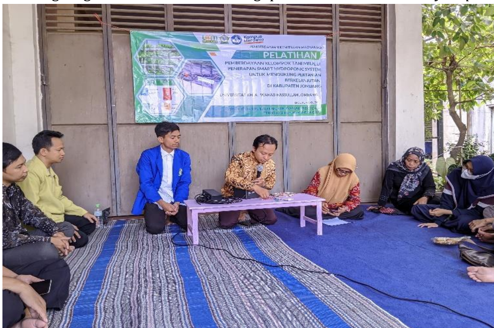
Gambar 1. Kegiatan Sosialisasi Implementasi Smart Hydroponic System

Implementasi teknologi Smart Hydroponic System yang dilaksanakan pada tanggal 11 Oktober 2024 di Pogo Farm, Kabupaten Jombang, dihadiri oleh anggota kelompok petani hidroponik setempat. Jumlah peserta yang hadir pada kegiatan tersebut sebanyak 15 orang peserta, yang terdiri dari petani hidroponik pemula dan yang sudah berpengalaman dalam pertanian hidroponik. Tingkat partisipasi peserta sangat tinggi, dengan antusiasme yang terlihat dari keterlibatan aktif dalam setiap sesi pelatihan, baik saat pemaparan materi maupun praktik. Selama pelatihan, peserta tidak hanya belajar tentang teori dasar hidroponik, tetapi juga praktik langsung dalam merakit dan mengoperasikan sistem smart hydroponic system .