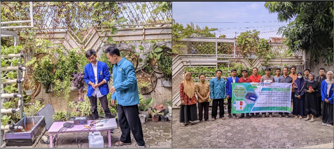
Gambar 2. Kegiatan Pelatihan Implementasi Smart Hydroponic System

Peningkatan Pengetahuan dan Keterampilan Peserta Evaluasi pre-test dan post-test menunjukkan peningkatan yang signifikan pada pengetahuan peserta terkait teknologi hidroponik, khususnya mengenai penggunaan sensor, pengaturan nutrisi, dan pemantauan otomatis melalui aplikasi. Rata-rata peningkatan skor tes mencapai 40%, yang menandakan bahwa materi pelatihan berhasil meningkatkan pemahaman peserta tentang konsep dan praktik teknologi Smart Hydroponic System. Selain itu, keterampilan teknis peserta dalam merakit sistem hidroponik juga meningkat, terbukti dari kemampuan mereka menyusun sistem hidroponik sederhana secara mandiri.