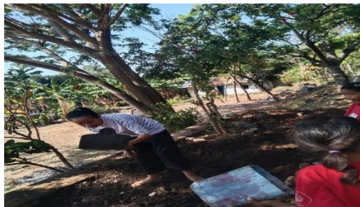
Gambar 1. Pembenahan lahan di SDK Boba

Pembenahan lahan di SDK Boba, Desa Boba melibatkan serangkaian langkah penting untuk memastikan kondisi tanah yang mendukung pertumbuhan tanaman hortikultura. Proses dimulai dengan pembersihan lahan, yang bukan hanya mencakup penghilangan gangguan fisik seperti gulma dan material organik yang tidak diinginkan, tetapi juga menciptakan lingkungan tanah yang bebas dari potensi penyakit dan hama. Langkah berikutnya melibatkan pemupukan, di mana penambahan nutrisi esensial seperti nitrogen, fosfor, dan kalium diperlukan untuk memberikan dukungan nutrisi yang optimal bagi tanaman. Selain itu, perbaikan struktur tanah menjadi fokus utama, dengan langkah-langkah seperti pemecahan tanah untuk meningkatkan drainase, penambahan bahan organik untuk meningkatkan kapasitas penyimpanan air, dan penyesuaian pH tanah. Langkah-langkah ini tidak hanya meningkatkan kesehatan tanaman, tetapi juga menciptakan kondisi pertumbuhan yang optimal. Dengan demikian, pembenahan lahan tidak hanya sekadar persiapan fisik, melainkan juga investasi dalam penciptaan lingkungan tanah yang menguntungkan bagi keberhasilan penanaman hortikultura di sekolah tersebut.