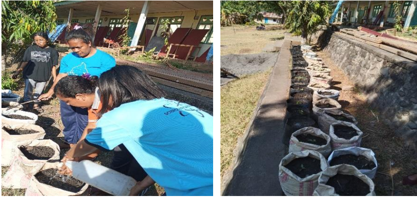
Gambar 4. Proses pemeliharaan dan pengelolaan kebun di SDK Boba

terhadap kebun, tetapi juga memberikan kesempatan praktis bagi mereka untuk belajar dan menerapkan konsep-konsep pertanian dan keberlanjutan yang telah mereka pelajari sebelumnya. Dengan demikian, pemeliharaan dan pengelolaan kebun bukan hanya tentang mempertahankan produktivitas, tetapi juga mengembangkan keterampilan praktis dan pemahaman mendalam tentang ekologi dan pertanian yang berkelanjutan di kalangan peserta didik dan staf sekolah.