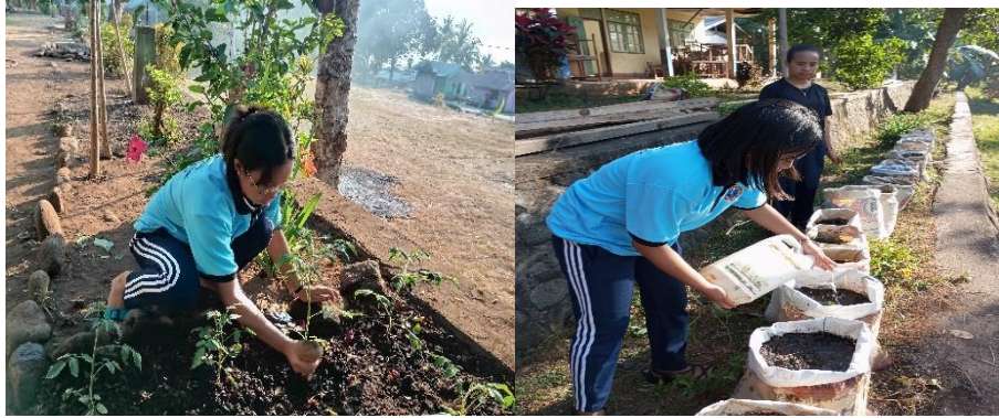
Gambar 2. Proses desain dan penataan kebun di SDK Boba

Pelibatan mahasiswa, siswa, guru, dan komunikasi yang efektif menjadi inti dari strategi pelaksanaan penanaman hortikultura di SDK Boba, Desa Boba. Pendekatan pendidikan praktis melibatkan mahasiswa, siswa, dan guru dalam kegiatan langsung yang berhubungan dengan budidaya tanaman, memungkinkan mereka untuk mengembangkan pemahaman yang mendalam tentang proses pertanian dan pentingnya keberlanjutan lingkungan. Selain itu, keterlibatan aktif dari semua komponen dalam pemilihan tanaman menciptakan dinamika partisipatif yang mencerminkan kebutuhan dan aspirasi bersama. Proses ini bukan hanya tentang memilih tanaman secara teknis, tetapi juga menciptakan peluang untuk berkolaborasi, berbagi ide, dan membangun keputusan kolektif. Komunikasi yang terbuka dan berkelanjutan antara mahasiswa, siswa, guru, dan pihak terkait lainnya menjadi kunci keberhasilan proyek, memastikan bahwa semua pihak terlibat secara aktif dalam setiap tahapan, dari perencanaan hingga pemeliharaan. Dengan demikian, pendekatan ini bukan hanya menciptakan kebun hortikultura yang produktif, tetapi juga memperkaya pengalaman belajar praktis dan kolaboratif bagi seluruh komunitas pendidikan di sekolah tersebut.