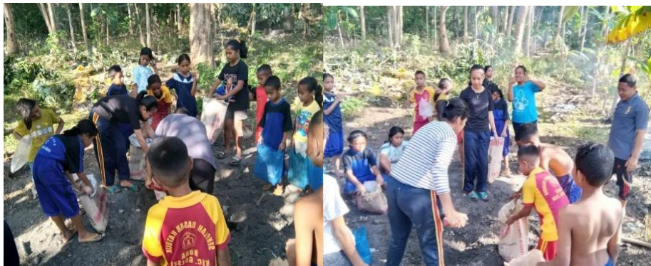
Gambar 3. Pelibatan mahasiswa, siswa, guru, dan komunikasi

Pelibatan mahasiswa, siswa, guru, dan komunikasi yang efektif menjadi inti dari strategi pelaksanaan penanaman hortikultura di SDK Boba, Desa Boba. Pendekatan pendidikan praktis melibatkan mahasiswa, siswa, dan guru dalam kegiatan langsung yang berhubungan dengan budidaya tanaman, memungkinkan mereka untuk mengembangkan pemahaman yang mendalam tentang proses pertanian dan pentingnya keberlanjutan lingkungan. Selain itu, keterlibatan aktif dari semua komponen dalam pemilihan tanaman menciptakan dinamika partisipatif yang mencerminkan kebutuhan dan aspirasi bersama. Proses ini bukan hanya tentang memilih tanaman secara teknis, tetapi juga menciptakan peluang untuk berkolaborasi, berbagi ide, dan membangun keputusan kolektif. Komunikasi yang terbuka dan berkelanjutan antara mahasiswa, siswa, guru, dan pihak terkait lainnya menjadi kunci keberhasilan proyek, memastikan bahwa semua pihak terlibat secara aktif dalam setiap tahapan, dari perencanaan hingga pemeliharaan. Dengan demikian, pendekatan ini bukan hanya menciptakan kebun hortikultura yang produktif, tetapi juga memperkaya pengalaman belajar praktis dan kolaboratif bagi seluruh komunitas pendidikan di sekolah tersebut.