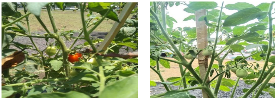
Gambar 5. Hasil Pembudidayaan

Pentingnya monitoring dan evaluasi dalam konteks kebun hortikultura di SDK Boba, Desa Boba, mencerminkan pendekatan yang berorientasi pada pembelajaran dan perbaikan berkelanjutan. Proses ini memberikan pemahaman mendalam tentang pertumbuhan tanaman, hasil panen, dan dampak kebun terhadap lingkungan sekitar. Monitoring yang teratur memberikan gambaran real-time tentang kesehatan dan perkembangan tanaman, memberikan kesempatan untuk mengidentifikasi potensi masalah atau kebutuhan tambahan. Evaluasi, pada gilirannya, memberikan pemahaman lebih luas tentang efektivitas strategi yang diimplementasikan dan dampaknya pada lingkungan dan komunitas. Hasil dari proses ini bukan hanya menjadi alat untuk memahami pencapaian proyek saat ini, tetapi juga menjadi dasar untuk perbaikan berkelanjutan. Dengan menganalisis data dari monitoring dan evaluasi, dapat dilakukan penyesuaian strategi dan implementasi proses kebun hortikultura di masa mendatang. Hal ini menciptakan siklus pembelajaran yang terus-menerus, memastikan bahwa kebun tidak hanya tetap produktif tetapi juga berkembang menjadi model yang lebih berkelanjutan dan efisien dari waktu ke waktu. Dengan demikian, monitoring dan evaluasi bukan hanya sebagai alat penilaian, tetapi sebagai instrumen utama dalam mengarahkan perbaikan dan inovasi dalam implementasi kebun hortikultura di lingkungan Pendidikan.