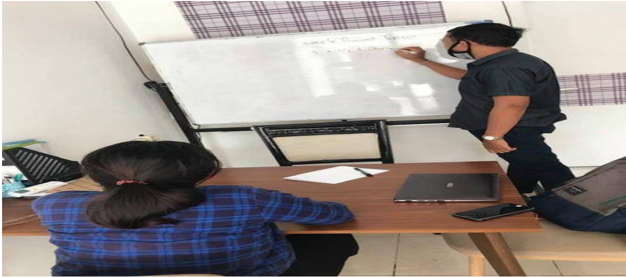
Gambar 1. Proses Kegiatan Belajar Mengajar Peserta di Dalam Kelas

kartu merupakan salah satu contoh permainan Bahasa Inggris dasar yang diberikan kepada peserta pelatihan Pengabdian masyarakat ini.