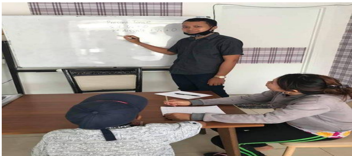
Gambar 2. Kegiatan Belajar Mengajar Peserta di Dalam Kelas