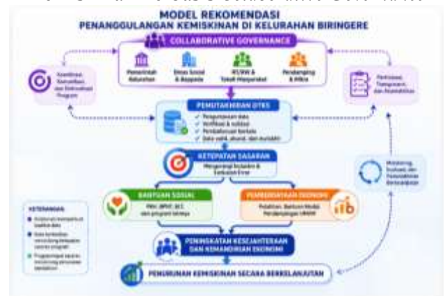
Gambar 2. Model Rekomendasi Penanggulangan Kemiskinan Berbasis Colaborative Governance

Berikut gambar model rekomendasi penanggulangan kemiskinan di Kelurahan Biringere Kecamatan Sinjai Utara Kabupaten Sinjai.