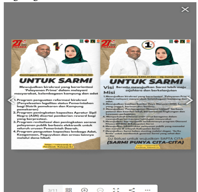
Gambar 2. Penggunaan Plugin 3D Flipbook

Plugin WpDiscuz mendukung interaksi dua arah antara tim kampanye dan pengunjung melalui fitur komentar. Analisis menunjukkan bahwa tingkat partisipasi pengunjung cukup tinggi, dengan banyak komentar yang relevan pada postingan terkait isu lokal. Hal ini mengindikasikan bahwa website telah menjadi wadah diskusi yang efektif, memungkinkan masyarakat untuk menyampaikan pendapat dan bertanya langsung.