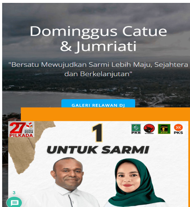
Gambar 3. Tampilan Halaman Utama Web Mobile

Pengujian kecepatan memuat halaman menunjukkan hasil memuaskan, dengan waktu muat kurang dari 3 detik pada perangkat mobile. Kecepatan ini memenuhi standar Google untuk pengalaman pengguna yang baik. Selain itu, elemen navigasi seperti tombol menu dan tautan terlihat jelas dan mudah diakses, bahkan pada layar kecil.