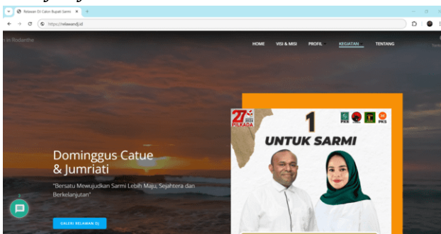
Gambar 1. Tampilan Halaman Utama Web

Navigasi website menggunakan menu drop-down yang sederhana tetapi efektif. Semua halaman penting dapat diakses dalam tiga klik atau kurang, sesuai dengan prinsip web usability. Fitur ini membantu pengunjung dari berbagai latar belakang, termasuk pengguna yang kurang berpengalaman dalam teknologi, untuk merasa nyaman saat menjelajahi konten.